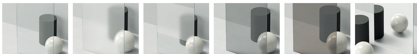
klar Sand Plus Privatima grau bronze Spiegelglas

1/4-Kreis-Anlagen nur in Klarglas (321/322) erhältlich.